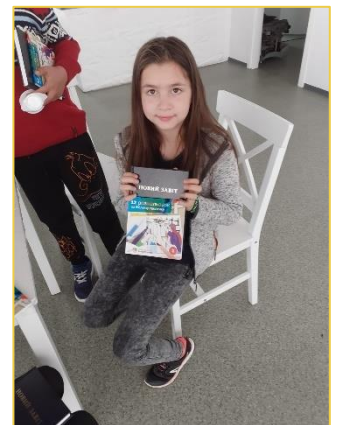
Mary Jones voor Roma & Sinti kinderen & het Evangelie voor Oekraïense vluchtelingen